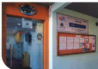
JM マイセカンドホーム コンサルタンシー