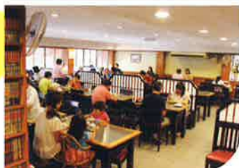
日馬和里レストラン