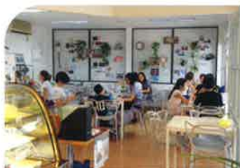
オーレックストラベル